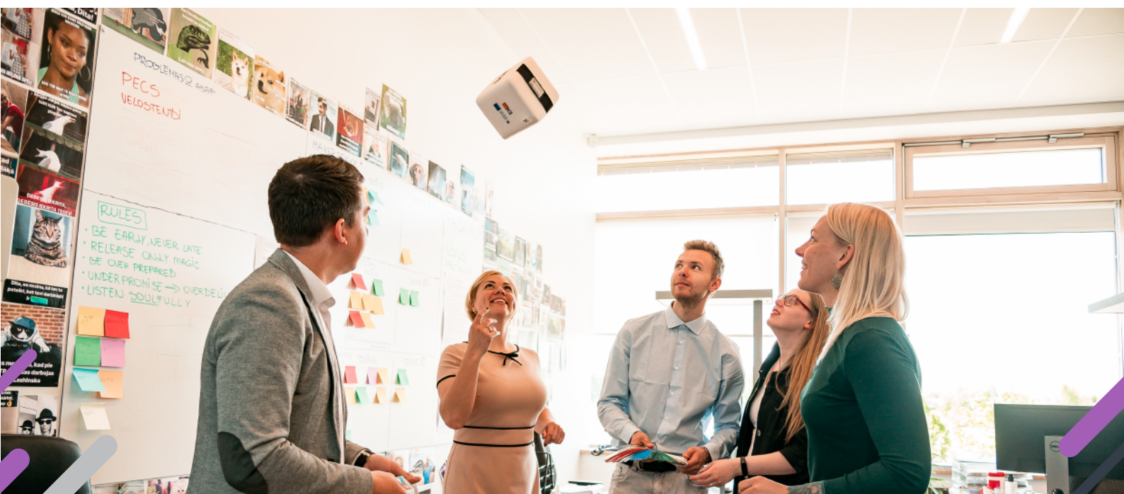
Attēls: “Dažādībā ir spēks” ilustratīvs attēls

Pašnovērtējumu veikušie darba devēji un plašāka informācija par kustību “Dažādībā ir spēks” ir pieejama tās tīmekļvietnē .