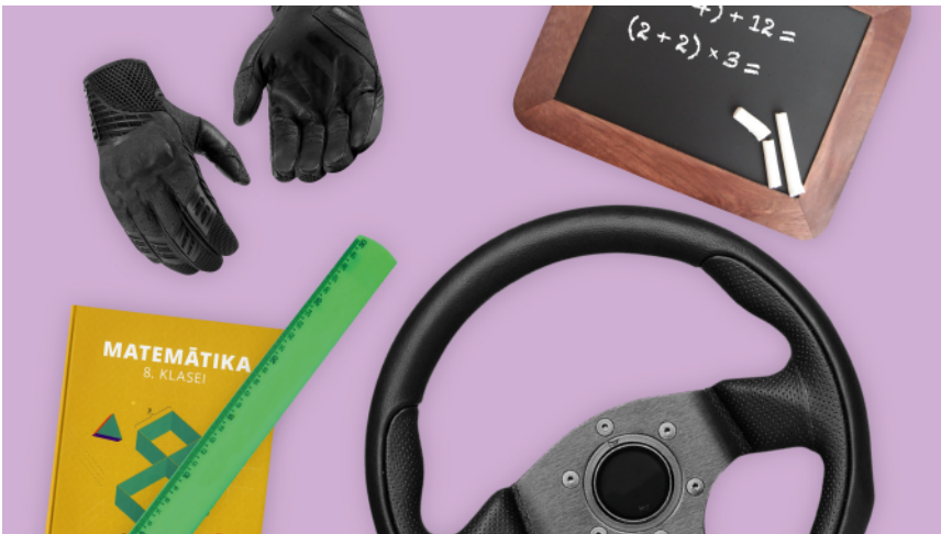
Attēls: Interaktīvais tests "Uzmini vecumu" stāsta ekrānšāviņš

Cilvēka vecums ir viens no galvenajiem faktoriem, kas nosaka pirmo iespaidu, tomēr tas var būt maldinošs, ja nezinām neko vairāk par šī cilvēka ikdienu. Visiem testā aprakstītajiem varoņiem ir reāli prototipi – dažādu vecumu cilvēki ar ļoti atšķirīgām profesijām un vaļaspriekiem. Trāpīgākie, kuri spēja visprecīzāk atminēt attēlos redzamo priekšmetu īpašnieku vecumu, tika pie iedvesmas čempiona titula, apliecinot atvērtu prātu un pozitīvu attieksmi pret pasauli (saskaņā ar testa rezultātiem tādu ir vien 3%). Tie, kuri lielākoties bija precīzi savos minējumos un vien reizēm krita stereotipu varā, ieguva piesardzīgā jaunatklājēja titulu (45%), bet aizspriedumainākie saņēma stereotipu vācelītes goda nosaukumu.