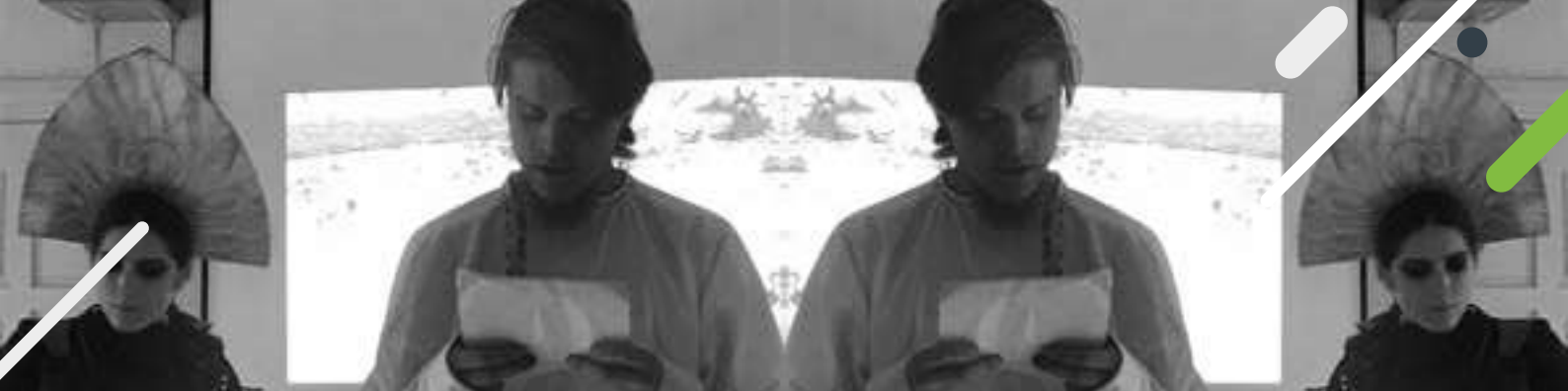
MASLO performance "D/z/eja" festivālā "Zemlika"