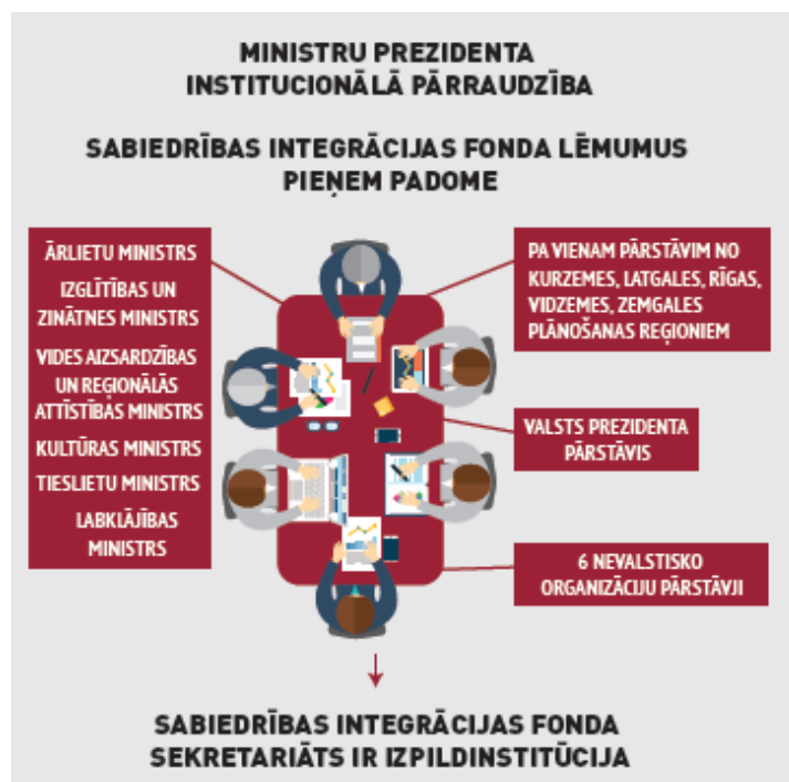
Infografika “Sabiedrības integrācijas fonds”

Savu mērķu īstenošanai Fonds apsaimnieko gan valsts budžeta, ārvalstu finanšu līdzekļus un darbojas kā projektu īstenotājs Eiropas Komisijas un ārvalstu programmās.