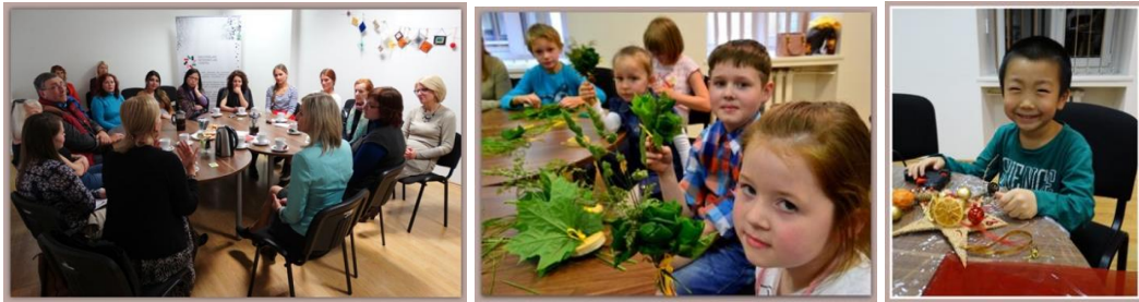
Attēls 4-6 NIC organizētās aktivitātes trešo valstu valstspiederīgajiem