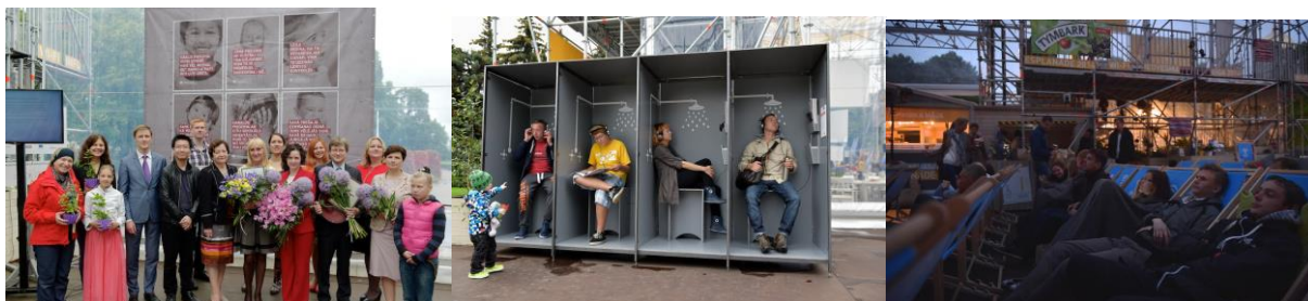
Attēls 1-3 ieskats projekta "Dažādi cilvēki, atšķirīga pieredze, viena Latvija" īstenotajās aktivitātēs