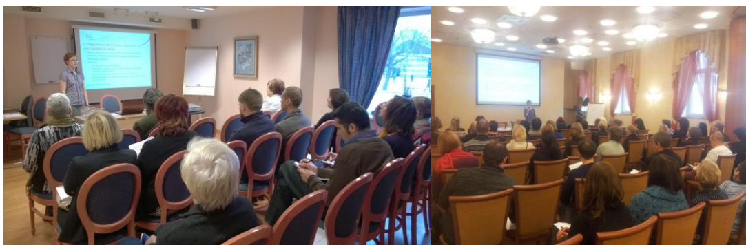
Attēls 7-8 EEZ FI informatīvie semināri

Valsts budžeta programmu ietvaros organizētos seminārus apmeklēja 148 dalībnieki