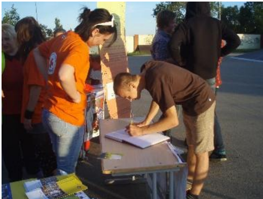
Viens no pasākuma dalībniekiem pievienojas Labas Gribas Memorandum

Velotūres laikā Fonda „Labas Gribas Memorandum” pievienojās vairāk nekā 700 cilvēki, tā ar savu parakstu apliecinot, ka atbalsta ideju par iecietību pret dažādām kultūras formām un cilvēciskās izteiksmes veidiem, un ir gatavi gan vārdos, gan darbos izskaust jebkāda veida diskrimināciju un neiecietību sabiedrībā.