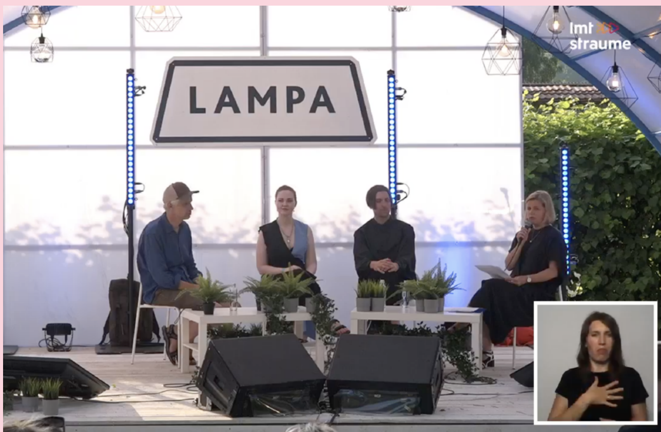
Attēls: SIF diskusija festivālā Lampa

Tāpat festivāla apmeklētājiem bija iespēja iepazīties ar cilvēku ar invaliditāti iespēju stāstiem “Dod iespēju” skapī, kā arī piedalīties empātijas darbnīcā.