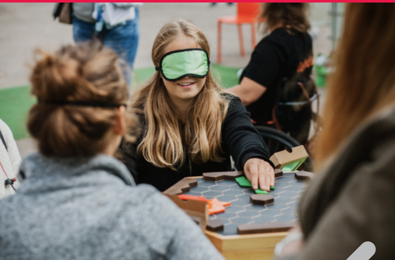
Attēls: Empātijas spēle