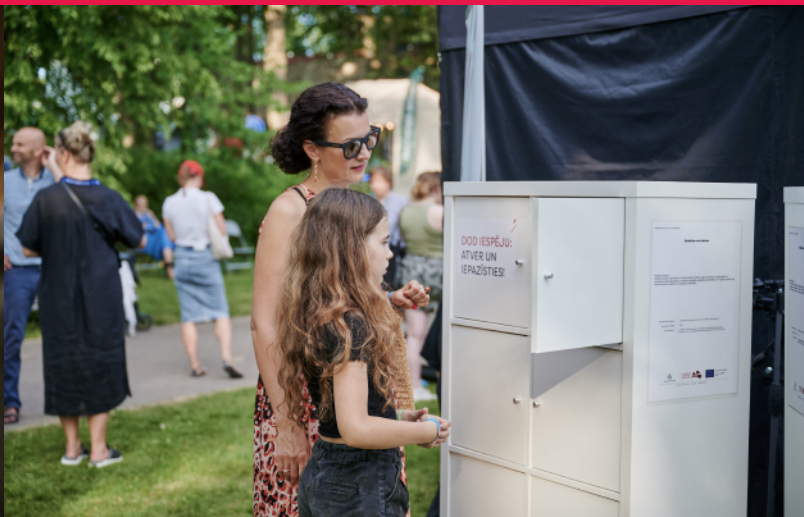
Attēls: "Dod iespēju" skapis sarunu festivālā LAMPA