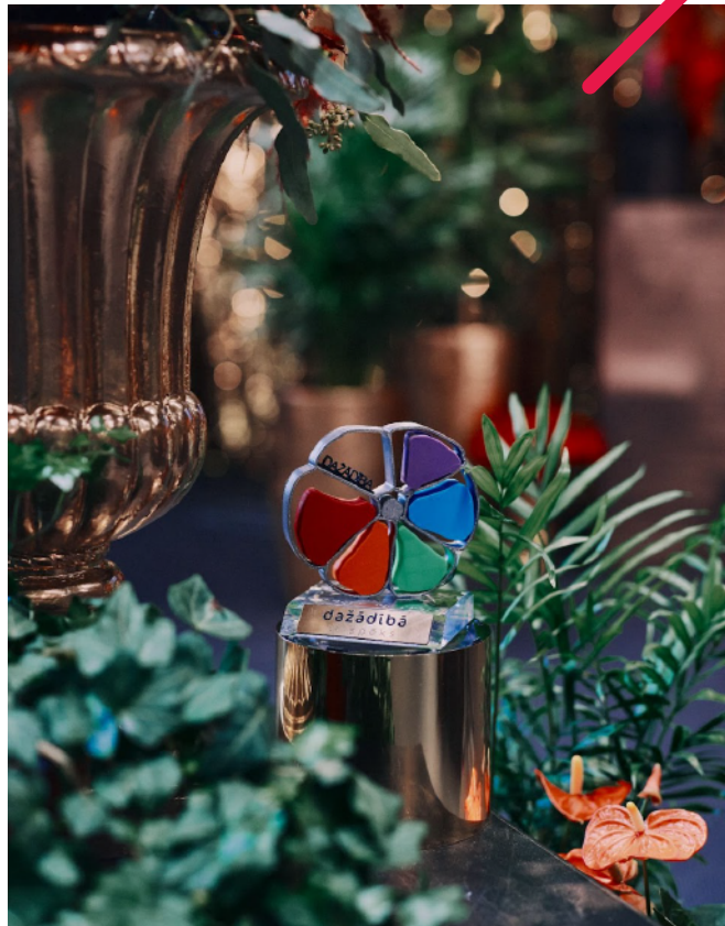
Attēls: “Dažādībā ir spēks” balvas darba devējiem

SIF sadarbībā ar Ventspils Augsto tehnoloģiju parku jau piekto gadu aicinājis darba devējus veikt kustības “Dažādībā ir spēks” pašnovērtējumu, lai izvērtētu dažādības vadības un iekļaujošas darba vides principus. Šogad pašnovērtējumu veicis lielākais darba devēju skaits kopš kustības dibināšanas brīža – 46 darba devēji. Darbu pie iesniegto anketu izvērtēšanas uzsākuši kustības eksperti, kuri sniegs darba devējiem individualizētus ierosinājumus darba vides pilnveidošanā. Noslēdzoties izvērtēšanas posmam, iekļaujošākie darba devēji tiks godināti apbalvošanas ceremonijā, bet pārējiem pašnovērtējumu veikušajiem darba devējiem tiks nodrošinātas dažādības vadības apmācības. 2022. gada dalībnieku saraksts meklējams ŠEIT .