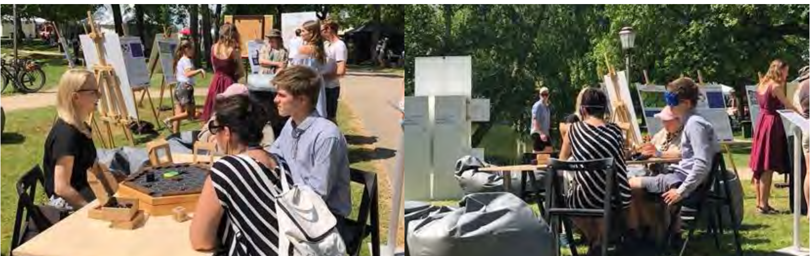
Attēli: Aktivitātes sarunu festivālā “Lampa”