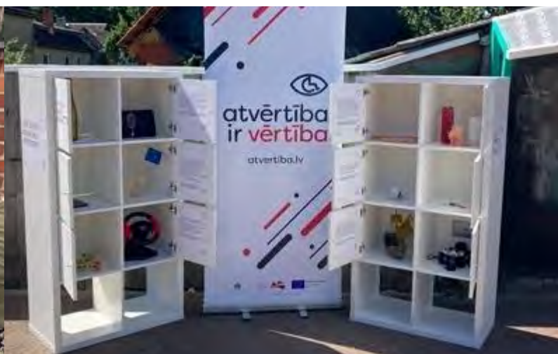
Attēli: Aktivitātes demokrātijas festivālā Kuldīgā