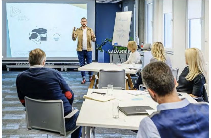
Attēls: “Skatu punkti” mācības

Plašāka informācija par mācību programmu “Skatu Punkti” un tās aktualitātēm pieejama tīmekļvietnē www.skatupunkti.lv un Facebook lapā Facebook.com/dazadibasveicinasana .