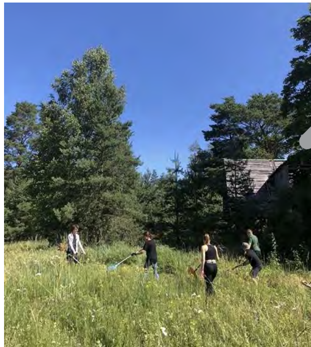
Attēli: "Dod iespēju" diena Mērsragā

Augustā Sabiedrības integrācijas fonda darbinieki kopā ar Latvijas Neredzīgo biedrības Vidzemes teritoriālās organizācijas biedriem devās uz koncertu "Baltijas Vikingi" Vidzemes koncertzālē, kur kā brīvprātīgie nodrošināja pavadonību cilvēkiem ar redzes traucējumiem.