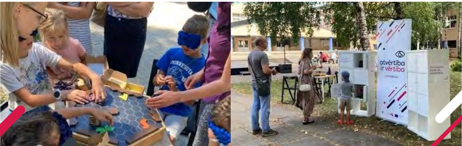
Attēli: Aktivitātes Saulkrastos