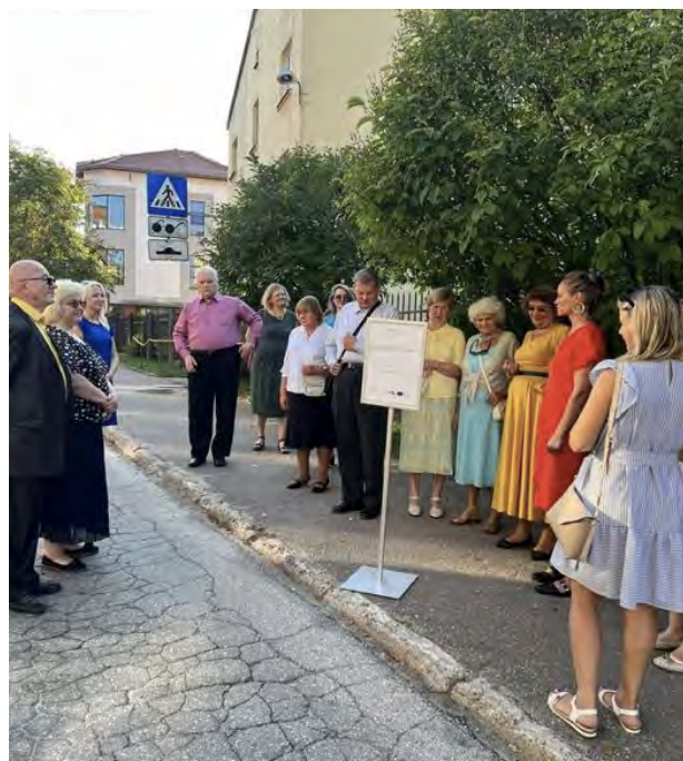
Attēli: "Dod iespēju" diena Cēsīs