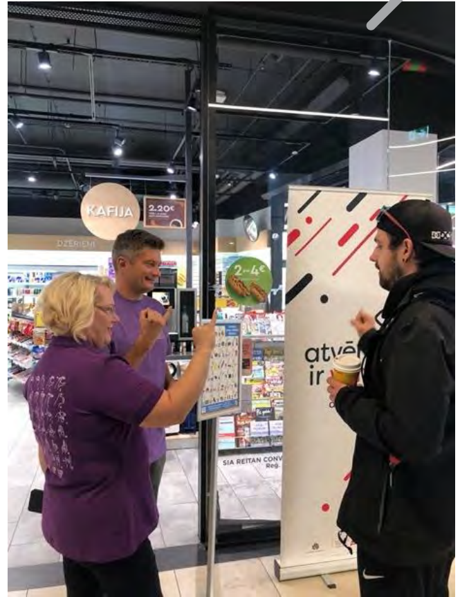
Attēls: Pasaules Nedzirdīgo diena 25. septembrī

Aktualizējot nedzirdības izraisītu invaliditāti un atzīmējot Pasaules Nedzirdīgo dienu 25.09., Sabiedrības integrācijas fonds kampaņas "Atvērtība ir vērtība" ietvaros kopā ar Latvijas Nedzirdīgo savienību un "Narvesen" aicināja ikvienu klātienē apgūt apgūt pamata zīmes zīmju valodā, kā arī zīmju valodas alfabētu.