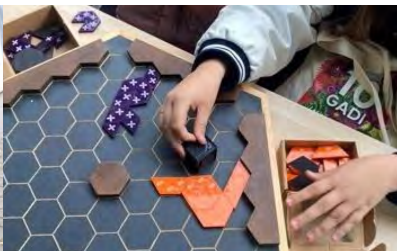
Attēli: Aktivitātes darba iespēju festivālā "Visiem!"