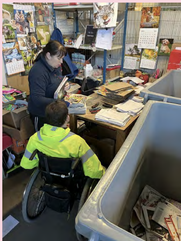
Attēli: Mentoringa dienas uzņēmumos