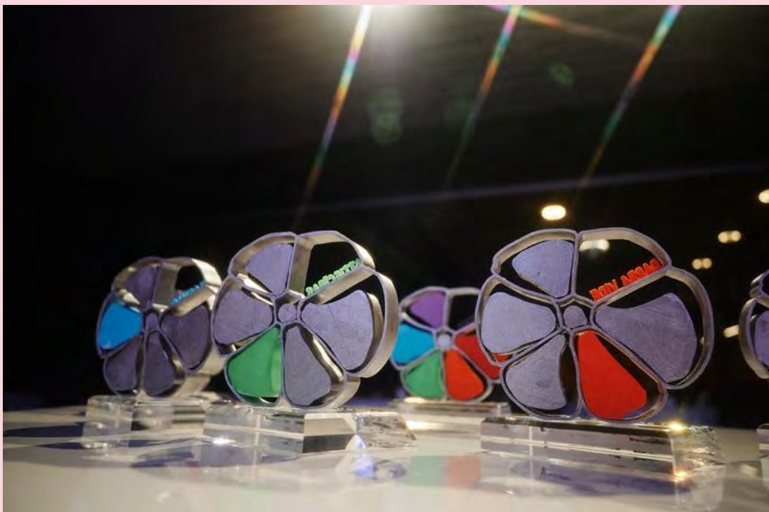
Attēls: “Dažādībā ir spēks” balvas darba devējiem

Kustības dalībnieki un laureāti gada nogalē saņems īpašas apmācības, lai uzsāktu vai attīstītu dažādības vadības un iekļaujošas darba vides pieeju ieviešanu darba vidē.