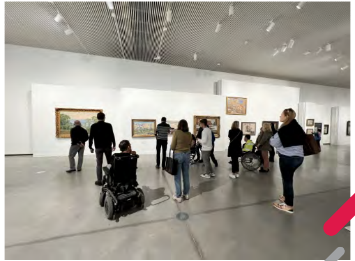
Attēli: "Dod iespēju" diena Rīgā

Lai gan, kampaņai noslēdzoties, jauni pieteikumi platformā vairs netiek pieņemti, platformā ir virkne biedrību pieteikumu, kas vēl gaida to īstenošanu.