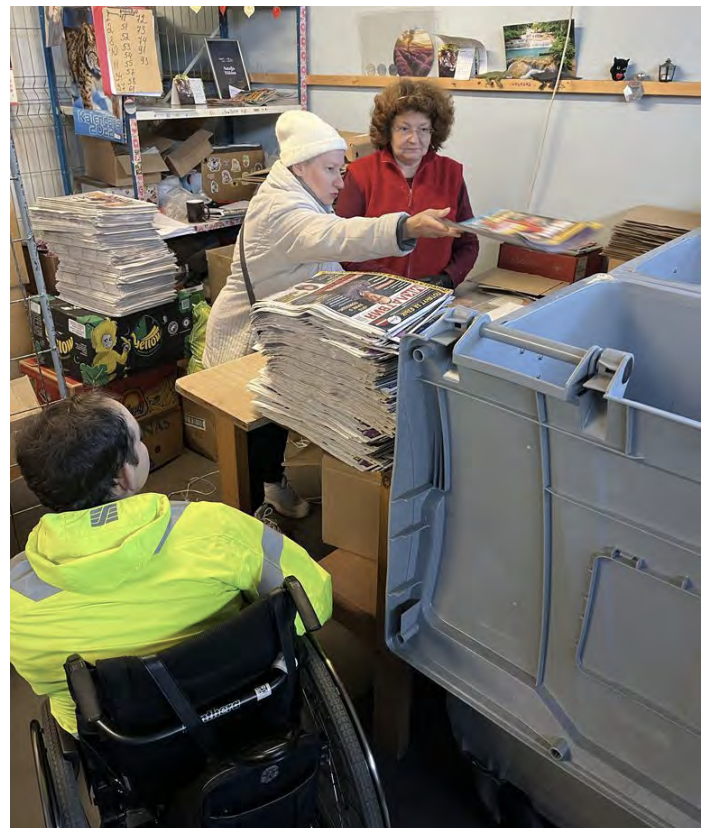
Attēls: Mentoringa dienas uzņēmumos

Divās mentoringa dienās durvis vēra dažādu nozaru uzņēmumi, stāstot par savu ikdienu, darbiem un iespējām nodarbināt cilvēkus ar invaliditāti. Lai iepazītos ar dažādiem amatiem, profesijām un izmēģinātu savus spēkus iepriekš nepazīstamā nozarē, šo divu dienu laikā uzņēmumos viesojās teju 20 cilvēki ar invaliditāti. Sava nama durvis atvēra dažādu nozaru uzņēmumi: SIA „Narvesen Baltija”, kas ir mazumtirdzniecības franšīzes tīklu “Narvesen”, “Preses serviss” un kafejnīcu ķēdes “Caffeine” pārvaldošais uzņēmums, kā arī vides pakalpojumu uzņēmums “Clean R”.