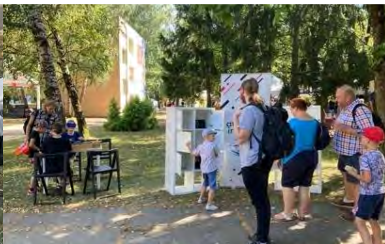
Attēli: Aktivitātes Rīgas apkaimju svētkos